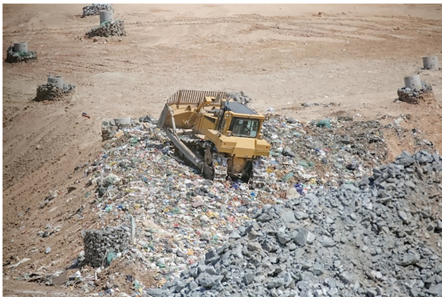
Figura 3. RCD