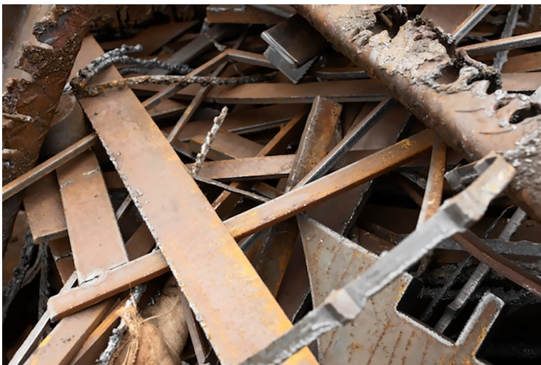
Figura 8. Residuos no peligrosos