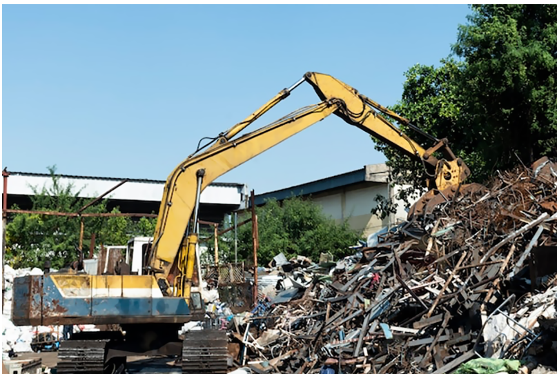
Figura 6. Desmontaje de residuos