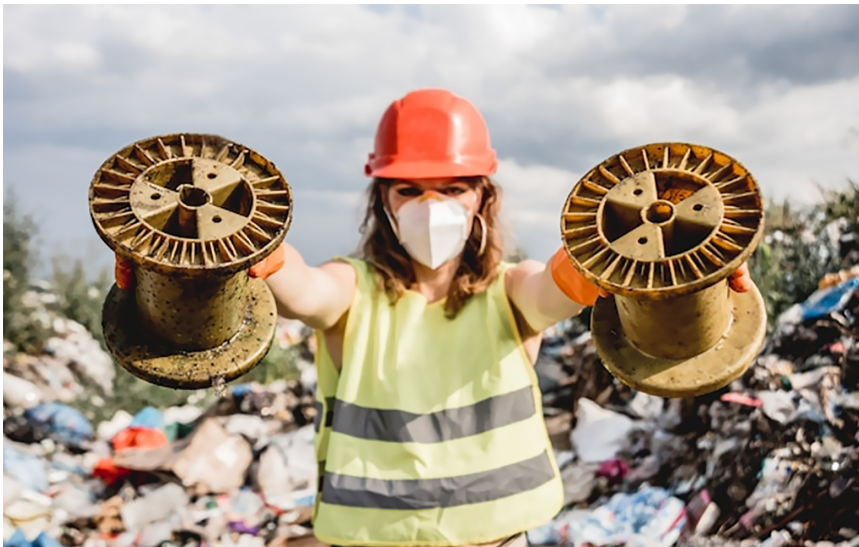
Figura 9. Residuos radioactivos