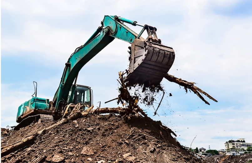
Figura 7. Residuos inertes de RCD